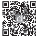
Smart Life app

Senzor slike: 2 x 1/3" 2MP F37 Processor: XM650V200 Rezolucija: 2.0MP + 2.0MP Kadrova u sekundi: 25fps Video Bit Rate: 2000 Kbps Kompresija: H.265X Video izlaz: Nema Šum signala: veće ili jednako 55dB IR diode: IR LED 4kom + 4kom bela LED IR domet: 10m IR aktivacija: automatska Minimalno osvetljenje: 0 Lux sa IR diodama Objektiv: fiksni 3.6mm Horizontalni ugao vidljivosti: 90° / 355° sa rotacijom Wi-Fi: Da, 2.4 Ghz Napajanje / Struja: 5V \overline{\text{---}} / 1A Radna temperatura: -10°C ~ +50°C Vlažnost vazduha: maks.95% IP zaštita: IP20 Materijal kućišta: plastika Dimenzije: 67x85x105 mm Masa: 320g Upravljanje sa udaljene lokacije: da PTZ kontrola (rotiranje): da Dvosmerna audio komunikacija: da Podrška SD memorijske kartice: microSD do 128GB